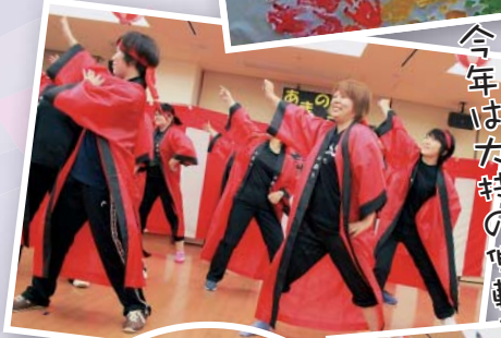
今年は大特の御転モ!