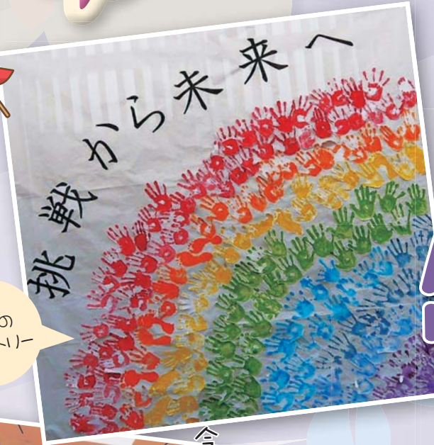
手形の タペストリー