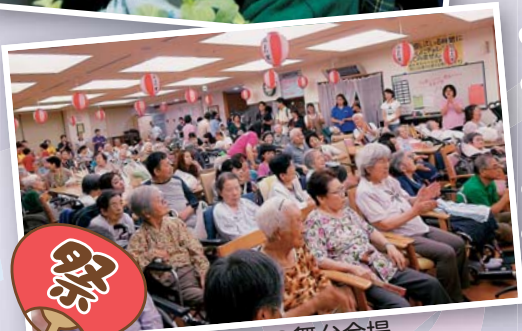
大賑わいの舞台会場