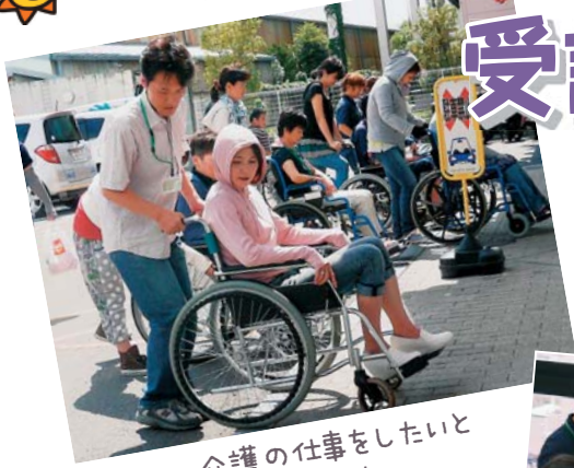
介護の仕事をした と思ってるあなた