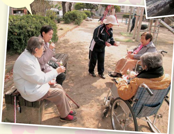
やっぱり 花よい 団子!

デイサービス木かげでは、毎年恒例で利用者の方々、楽しみにされている桜のお花見に4月4日(金)から約1週間かけて出かけました。