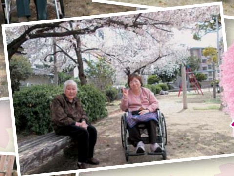
デイサービス 木かげ