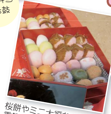
桜餅やミニ大福など可愛く 重箱に詰めました