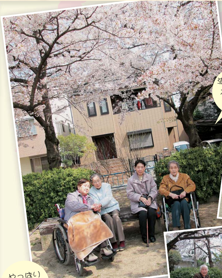
満開の桜の 木の下で ポーズ