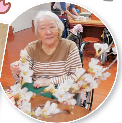
桜の枝をいただいて 屋内でもお花見