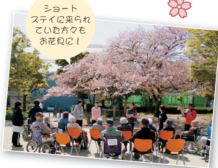
シヨートステイに来られていた方々もお花見に!

今年も4月1日から新入職員研修が行われました。研修期間の1週間は講義だけではなく、介護技術研修や配属先以外の部署での体験研修など、参加型の内容も多く含まれます。日頃は中に入る事がない厨房体験もあり、新人には大好評でした。これからも職場内・職場外に関わらず連携をとって仕事をすすめていけるように期待しています。