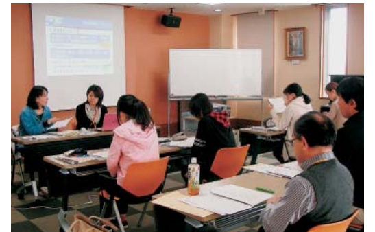
新入職員研修 行いました

今年も4月1日から新入職員研修が行われました。研修期間の1週間は講義だけではなく、介護技術研修や配属先以外の部署での体験研修など、参加型の内容も多く含まれます。日頃は中に入る事がない厨房体験もあり、新人には大好評でした。これからも職場内・職場外に関わらず連携をとって仕事をすすめていけるように期待しています。