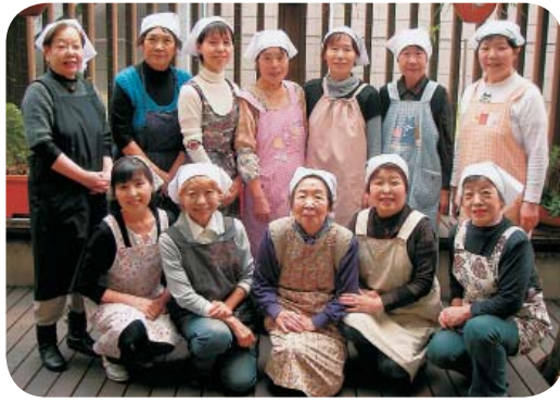
毎月1回、利用者様に季節感あふれる お食事を作ってくださいている 「だいこんクラブ」の皆さんです