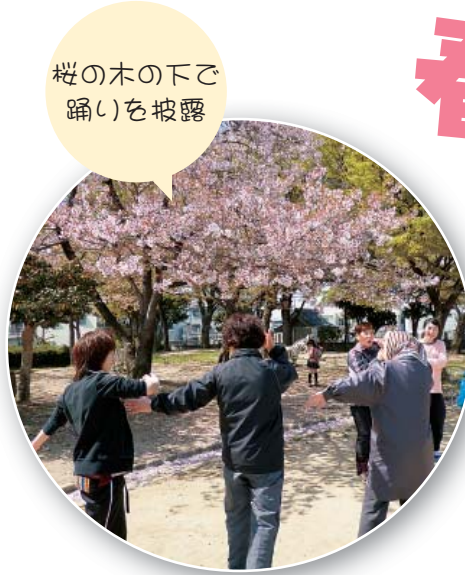
桜の木の下で踊りを披露