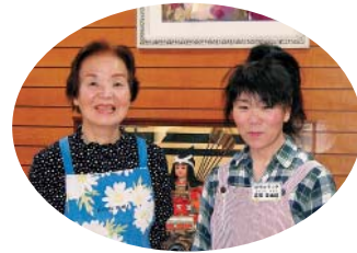
デイサービスのボランティア さんです。入浴後の髪の毛を 乾かしたり、お茶を入れたり、 利用者様のお話相手をして いただいています