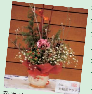
華やかで可愛いフラワーアレンジメント (光輪花クラブ)