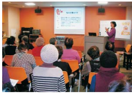
まずは、認知症の特徴や対応を学習しましょう！

る「頭の体操」や、認知症タッチパネルを用いて「脳の健康チェック」を行いました。地域の老人会の方や、利用者家族の方など名ほど参加され、楽しい学習会となりました。