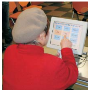
わくわくドキドキ脳の健康チェック

る「頭の体操」や、認知症タッチパネルを用いて「脳の健康チェック」を行いました。地域の老人会の方や、利用者家族の方など名ほど参加され、楽しい学習会となりました。