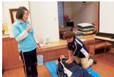
いざという時の人工呼吸実演!!

に話されていました。参加されたボランティアさんから、脱水時の対応や嘔吐物の処理方法など質問があり、「聞けてよかったです」「分かりやすかった、自宅でも対処方法が理解できました」などという声も聞かれました。