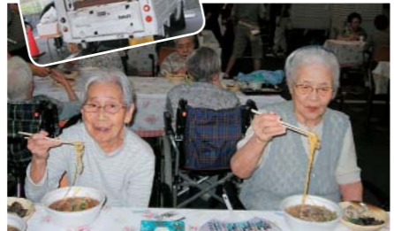
本物は美味しいわー

もうすぐ『夜鳴きそば』が恋しい季節です。あまの里では一足早く、屋台のラーメン屋さんに来てもらい、みんなで食べました。夜、屋外で食べる夜鳴きそばはウマイ!