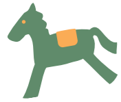
借り物競走。 「馬のかぶり物」