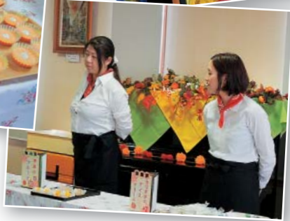
店員役のスタッフも正装で

今回のお茶会(9/25)のテーマは、「収穫祭」です。かぼちゃのケーキ・トマートのジュレ・さつま芋アイス・栗のプリンなど13種類の野菜や果物を使った手作りおやつが並び、バイキング形式で好きなものを選びました。お茶会企画は毎回大好評で、普段食欲のない方も、喜んで食べてくれます。職員もそんな利用者さまの様子が励みになります。