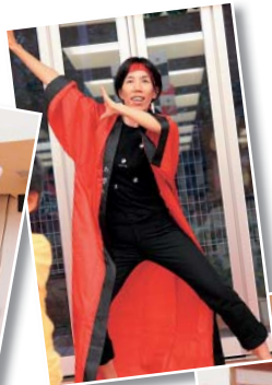
よさこい ソーラン