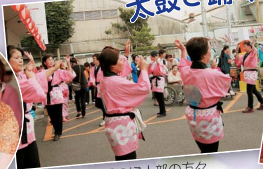
地域の婦人部の方々