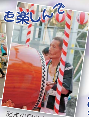
あまの里の太鼓名人