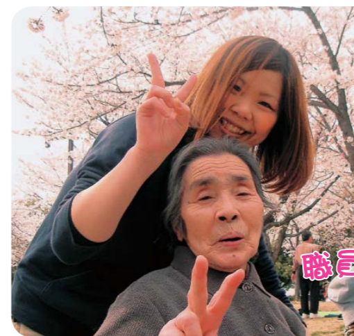
職員とハイポーズ