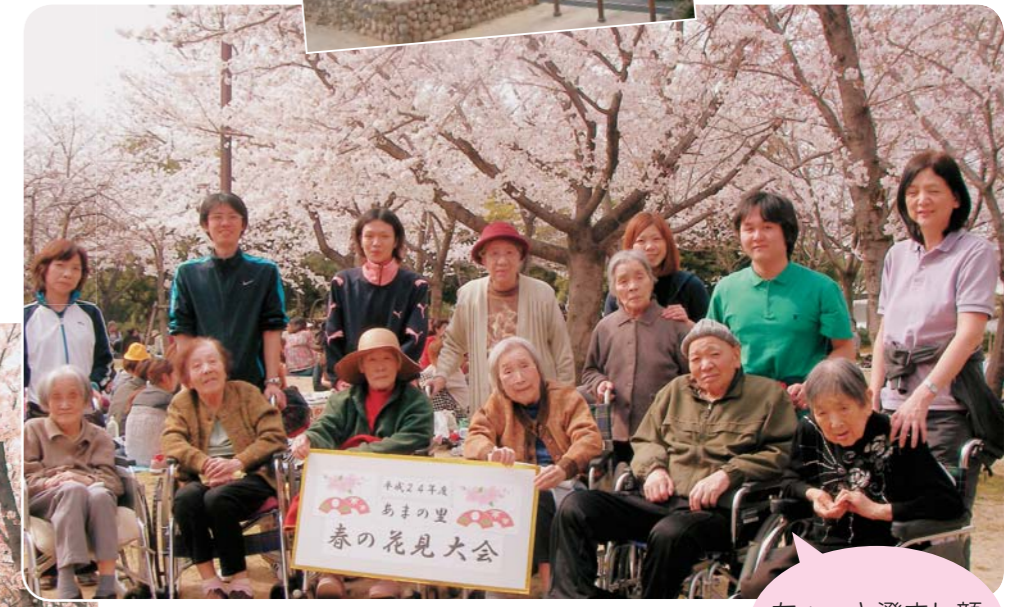
ちょっと澄まし顔で記念撮影