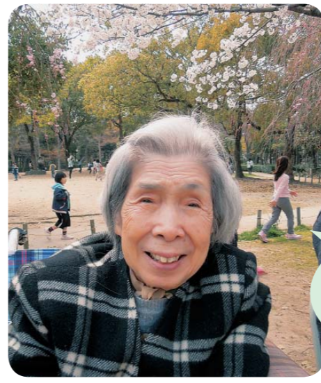
満開の桜と心地よい風に吹かれて