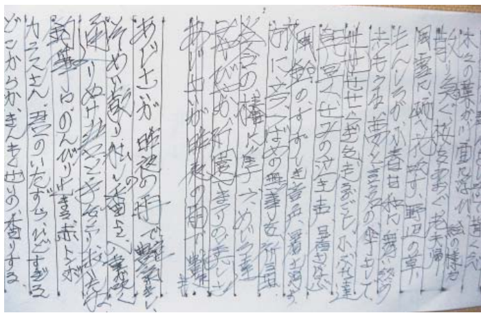
日頃から書き留めておられる俳句