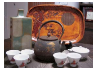
十二代 柿右衛門 煎茶セット