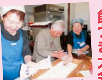
ボランティアさんとお餅丸め