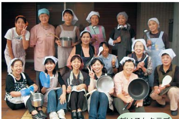
だいこんクラブの皆さん

食べ物美味しい季節になりました。日頃は小食の入居者さんも、美味しいそうな臭いや盛り付けに笑顔がこぼれ、和気あいあいと楽しく過ごされています。今回は毎月1回行事食を作っていた「だいこんクラブ」の皆さんを紹介