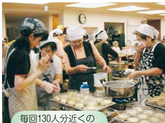
毎回130人分近くの食事を作っています

いつも大好評です。ボランティア食事を外にもおやつ作り教室を行ったり、お店に食事に出かけたり、握り寿司の出張パーティー（目の前で握りすしを握ってもらって食べる）を行ったり、食を楽しむ企画満載のあまの里です。