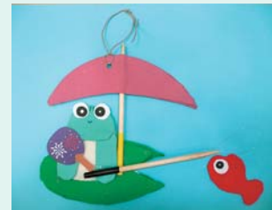
梅雨のクラフト 布と厚紙で作りました。