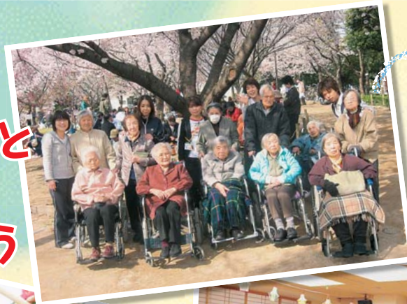
溝手公園での お花見