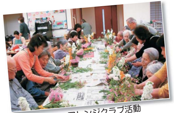
フラワーアレンジクラブ活動